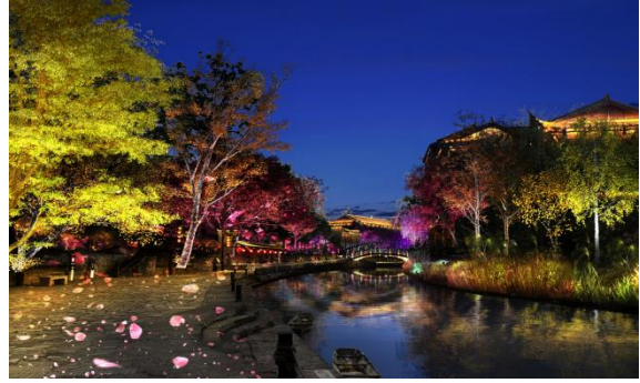
黔江区濯水景区业态提升项目- 濯水景区夜景照明灯饰工程（二期）