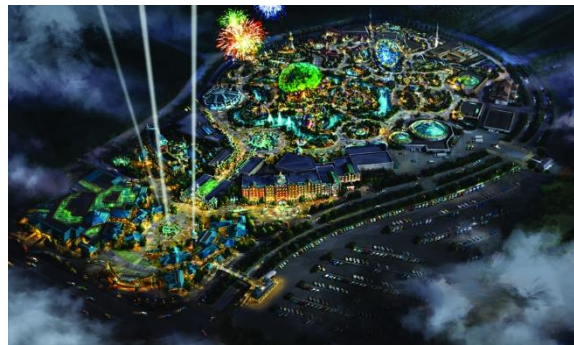
郑州海昌海洋公园项目（二期）泛光照明方案至施工图设计