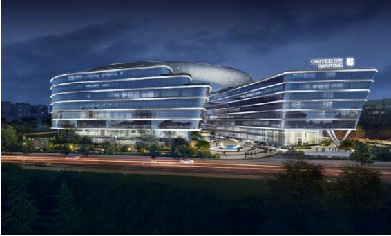
上海市长宁区临空经济园区 1 号地块联影智慧医疗园 新建项目泛光照明专业工程