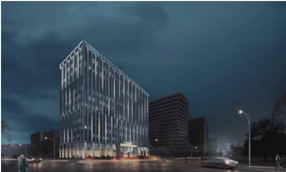
永诚大厦（上海世博 A03C-01 地块）建设项目泛光照明工程