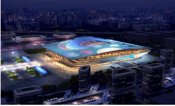
西安国际足球中心项目 EPC 工程 建筑夜景照明工程（一标段）