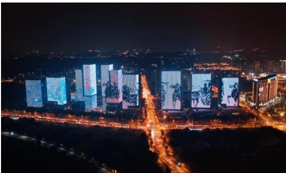
徐州金融集聚区延昆仑大道地块泛光照明工程