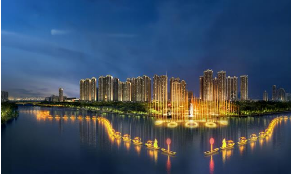
南安市西溪两岸夜经济生活基础设计提升工程

1、截至披露日，公司完成和承接一批重点照明工程项目，新增项目有：南安市西溪两岸夜经济生活基础设计提升工程、中国第二历史档案馆新馆项目泛光照明项目、永诚大厦（上海世博 A03C-01 地块）建设项目泛光照明工程、华峰集团研发总部项目泛光照明工程、湖南大学无锡智能控制研究院科研用房项目、郑州海昌海洋公园项目（二期）泛光照明方案至施工图设计、鄂州市文化中心、体育中心、会展中心 PPP 项目文化中心项目泛光照明设计、上海市长宁区凌空经济园区 1 号地块联影智慧医疗园新建项目泛光照明专业工程、黔江区濯水景区业态提升项目、金外滩国际广场 2023 年度维保等。新增项目以及其他已承接的主要新增项目（含效果图）如下：