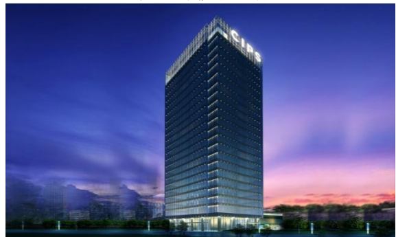
金外滩国际广场 2023 年度维保项目