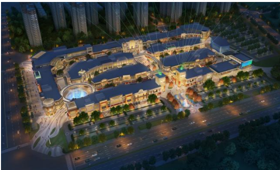
多弗地产山西清徐南湖城 B-7-2 地块 泛光设计服务及咨询项目