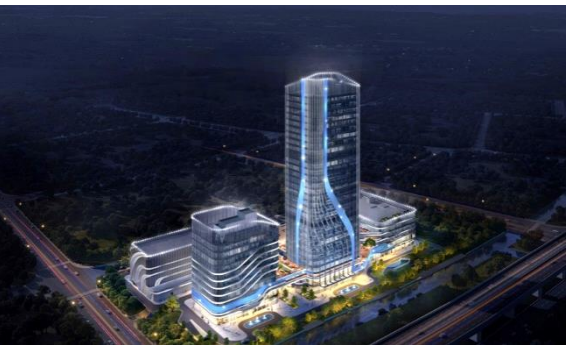
湖南大学无锡智能控制研究院科研用房项目