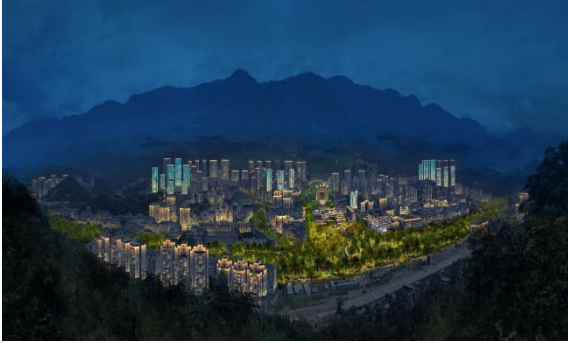
巫溪县城市绿色照明升级改造及基础设施 改造工程 EPC 总承包