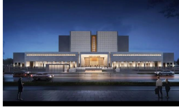
中国第二历史档案馆新馆项目泛光照明项目