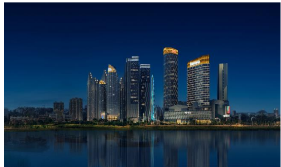
泉州市东海城东片区及晋江、洛阳江两岸 照明提升工程（市级国企投资部分）项目（包 4）