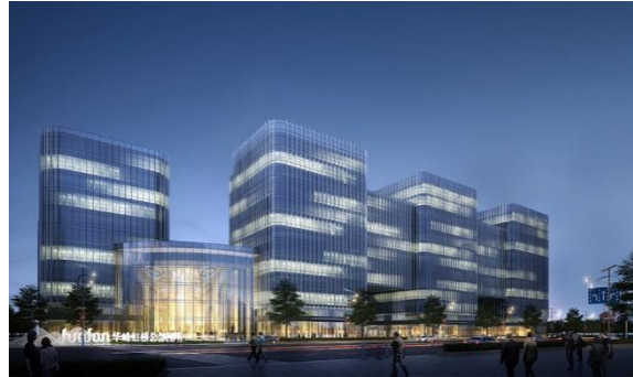
华峰集团研发总部项目泛光照明工程