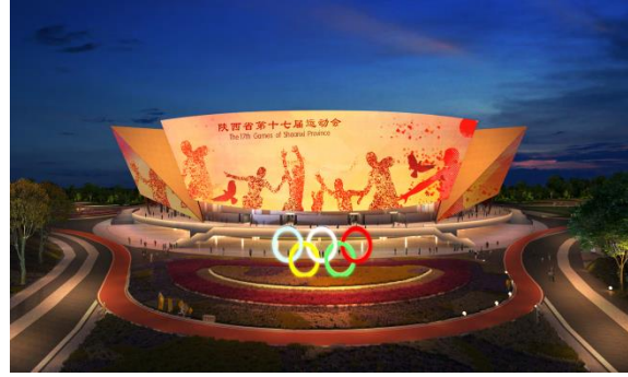
陕西省第十七届运动会体育中心 夜景亮化氛围营造专项提升采购项目