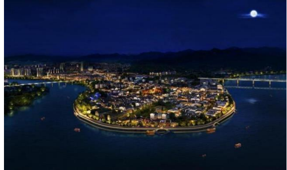
黔阳古城文旅旅游开发建设项目建设工程总承包（一期） 项目古城亮化一期